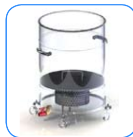
Rooster met aftap