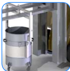
Hijsbeugels voor lossen middels vorkheftruck