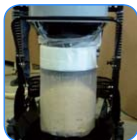
Afzaksysteem middels wegwerpzakken