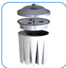
Hepa filter H14, upstream