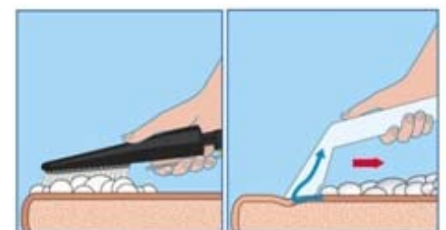
Schuim extractie meubelreiniging