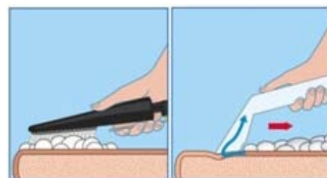
Schuim extractie meubelreiniging